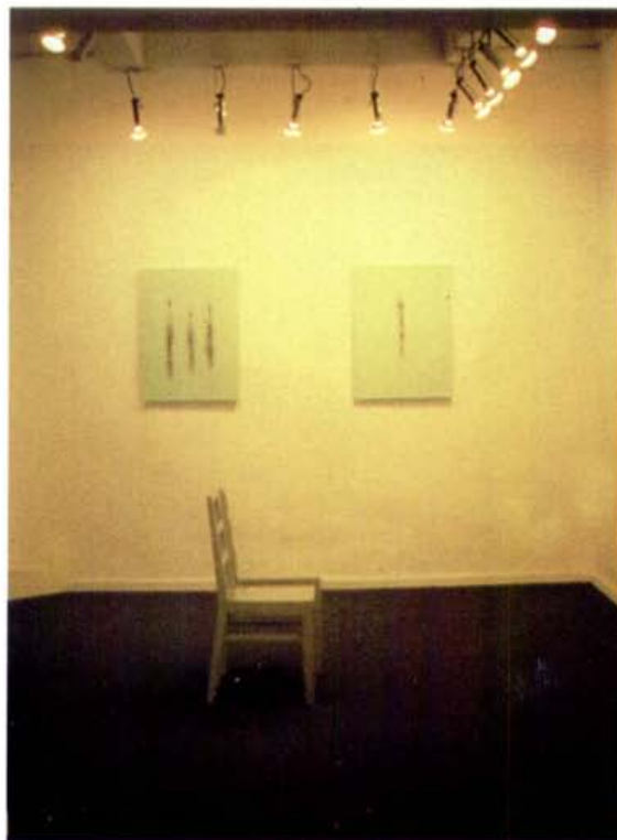
Valia Carvalho. "Sala de espera." 1997.