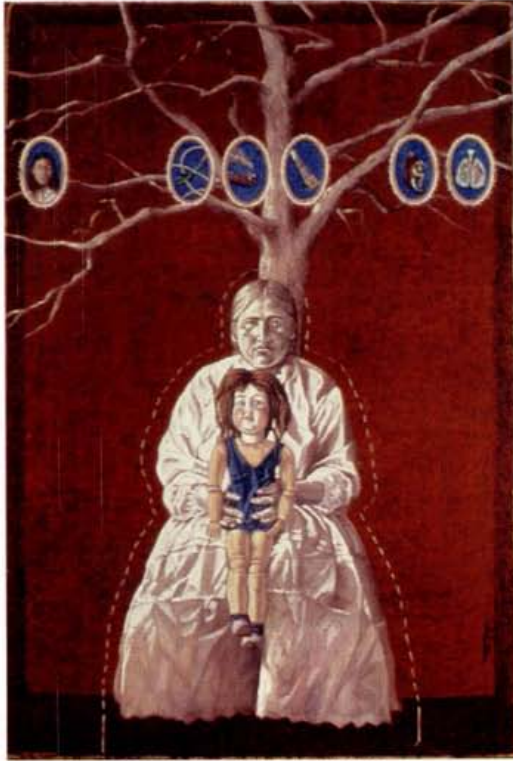
Guiomar Mesa. "Mujer de piedra." 1997.