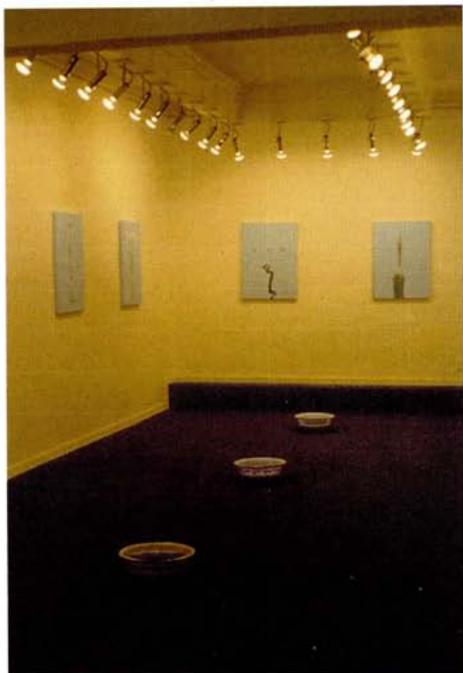
Valia Carvalho. De la serie "Sala de espera." 1997