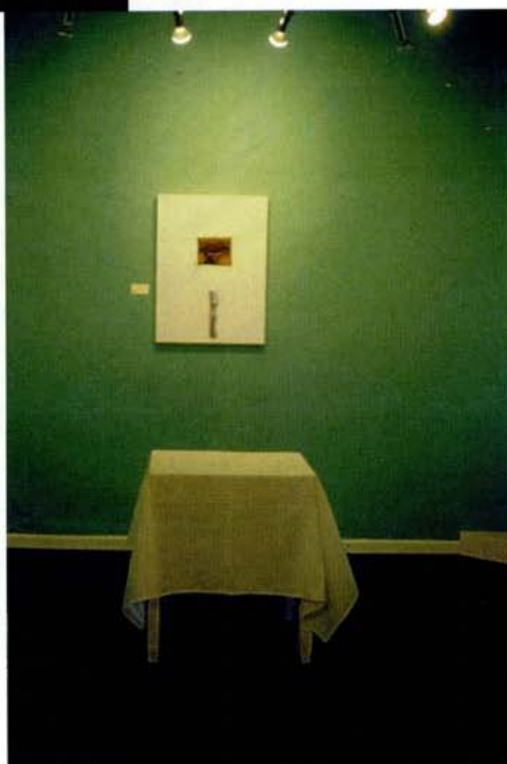
Valia Carvalho. De la serie "La vida en el limbo." 1997.