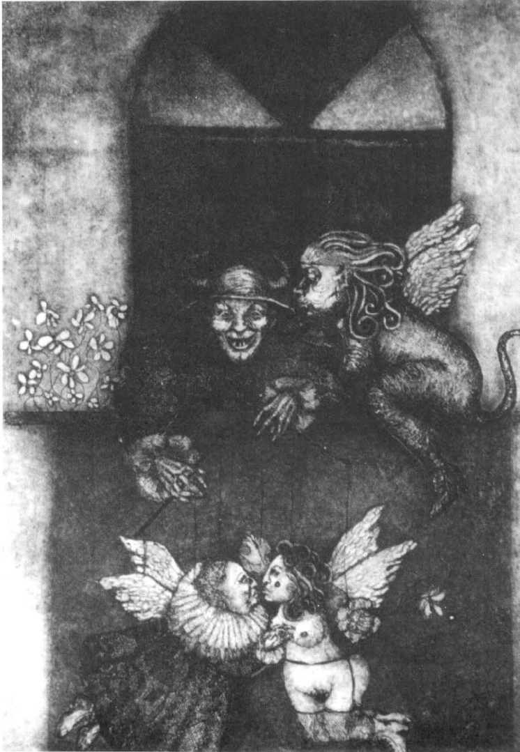
"Titrintero" Grabado sobre cobre