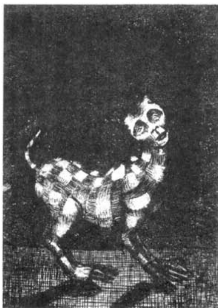
"Gato" Grabado sobre cobre

Además de la experiencia de Radio San Gabriel, años después, se fueron constituyendo otras radioescuelas en el país, todas bajo el apoyo de la iglesia católica y de sus emisoras. Así aparecieron, Radio Pío XII, Radio San Rafael, con una excelente experiencia de alfabetización con campesinos quechuas del valle, tentativa que lamentablemente no se extendió al cancelarse la radioescuela. Luego aparecieron radios como Fides y Loyola, las que en 1996 constituyeron la red de ERBOL (Escuelas Radiofónicas de