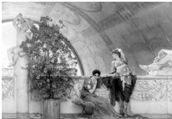
Sir Lawrence Alma-Tadema, Ritales inconscientes .

Debe remarcar que no se hace desarrollo de un puesto, sino del empleado específico, porque tiene un potencial que se quiere entrenar para que llegue a un puesto directivo, gerencial o de responsabilidad en un plazo determinado. Además,