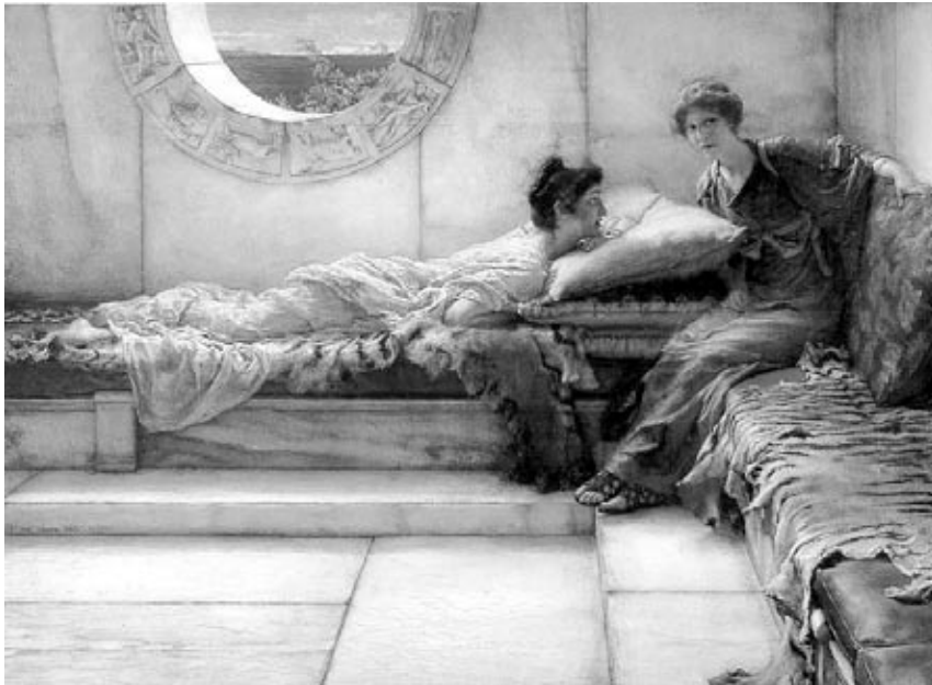
Sir Lawrence Alma-Tadema, Secreto .