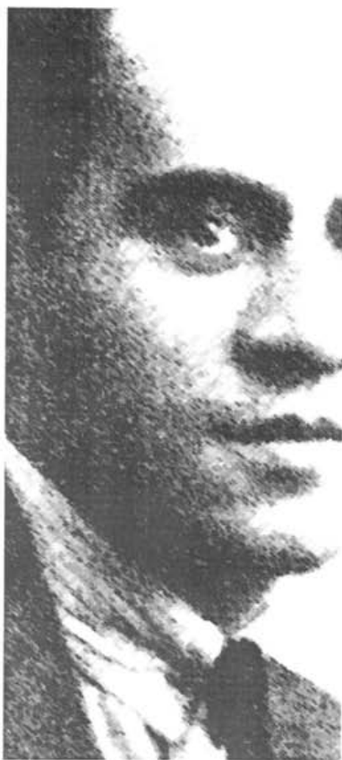
Humberto Viscarra Monje

Años más tarde, cuando regresé de Polonia, luego de haber estudiado en la Escuela Superior de Música de Varsovia, grande fue mi sorpresa al enterarme que mis padres habían tomado en alquiler nada menos que el mismo departamento donde murió Viscarra Monje y, por si fuera poco, me encontré que allí también habían cobijado —clandestinamente— a Nilo Soruco, ese indomable trovador chapaco que a fuerza de querer seguir tañendo sus plañideras coplas “revolucionarias” se veía forzado a vivir a salto de mata, de escondite en escondite, a causa de su porfiado deseo de vivir o morir en la “Bolivia libre” que tanto él soñaba. ¡En esa casa tuve que vivir un buen tiempo!