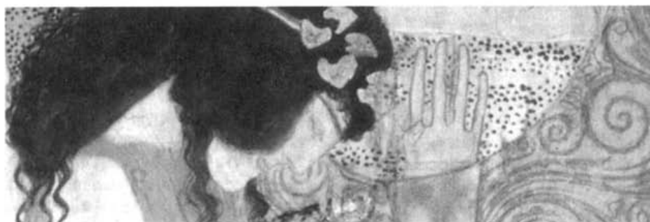
Gustav Klimt, Beethoven , 1902.

Por lo demás, un año antes de viajar a Polonia, se me presentó la curiosa oportunidad de ser Director Nacional de Cultura. Acometí el reto con denuedo, pese a mi juventud; pero creo que ahí quedó marcado una especie de sino que no me ha dejado en toda mi vida: ser administrador, facilitador, inventor y gestor, todo esto para los otros. Nadie hizo nada parecido para mí, nadie. Pero siempre he pensado que sólo lo que uno inventa es, al final, verdadero. Me pregunto —a veces— cómo fue