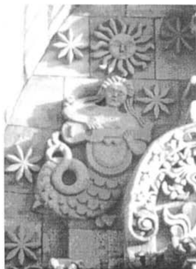
Sirena con charango, detalle portada de San Lorenzo.

—Con cuidado, papito. Con cuidado —advierte una voz femenina. Y pronto se ve una vacilante imagen cual si fuese Cristo descendido de la cruz. Una túnica blanca, que bien podría ser una sábana, cubre el cuerpo magro de un hombre al que llevan en vilo, con los brazos abiertos a los costados. Hay voces de hombres y de mujeres, todas sigilosas y reclamando siempre cuidado. Sumergen el cuerpo en las aguas calientes. Los vapores nublan la escena que se pierde en la irrealidad.