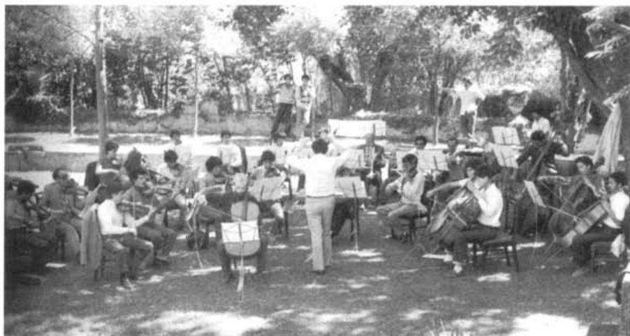
Orquesta Municipal de Cámara de La Paz. En concierto en el Palacio Portales de Cochabamba (1984).