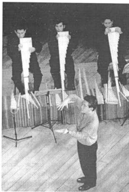
La Orquesta Experimental de Instrumentos Nativos.