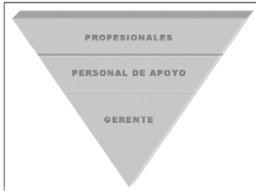
Gráfico 2 Organización invertida: Los expertos en sus campos profesionales toman las decisiones

Fuente: James Brian Quinn et al., 1998, p.198.