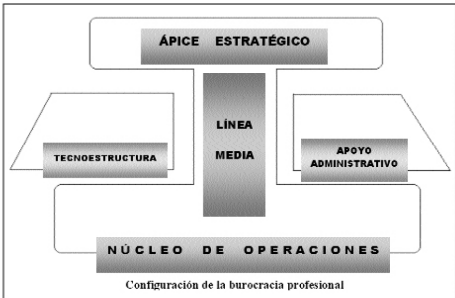
Gráfico 3 Partes de una Burocracia Profesional

“1) Una esfera de obligación para cumplir con las funciones que han sido delimitadas como partes de una división sistemática del trabajo, 2) la atribución al titular de esas funciones de autoridad para ejecutar, y 3) una definición clara del uso de los medios, de las exigencias y de las condiciones en las cuales son usadas”. (Blacutt, 1980, p.32). En una burocracia maquinal una división sistemática del trabajo, los derechos y del poder es esencial.