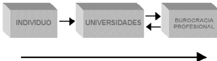
Gráfico 1 Flujo de recursos humanos de las universidades hacia las organizaciones de profesionales