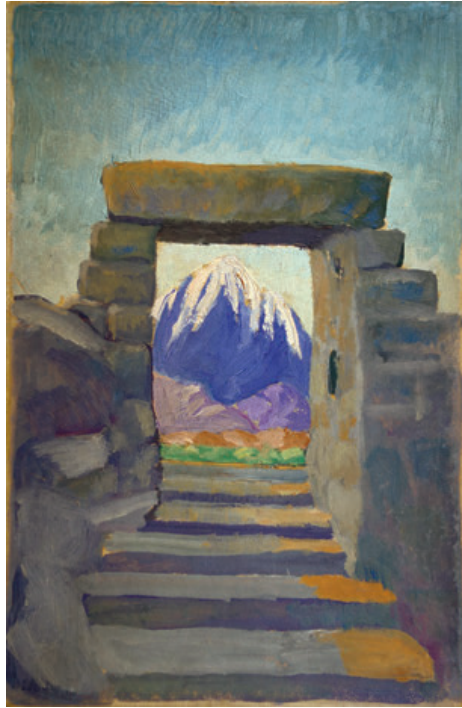
Figura 3. Gregorio López Naguil: Paisaje incaico (1939). Óleo sobre cuero, 24,5 x 16,5 cm. Pintado sobre la encuadernación de un ejemplar especial de: Ricardo Rojas. Ollantay. Tragedia de los Andes . Buenos Aires, Editorial Losada, 1939. Ejemplar dedicado por Rojas y todos los actores de la obra. Colección MLR.