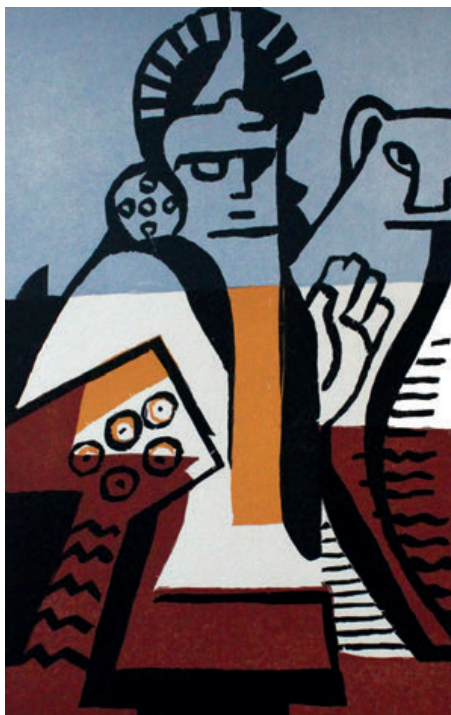
Figura 2. Pablo Curatella Manes. Grabado al boj para: Miguel A. Mossi (trad.). Ollantay. Drama Kjechua . Madrid-París-Buenos Aires, Agrupación de Amigos del Libro de Arte, 1931. Ejemplar N° 245 de una tirada total de 300 en papel Arches, impreso para el Señor de la Casa de Rubianes Marqués de Aranda. Colección MLR.