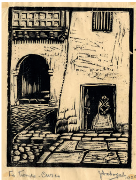
Figura 1. José Sabogal: La tienda, Cuzco (1925). Xilografía sobre papel, 20 x 15 cm. Colección MLR.