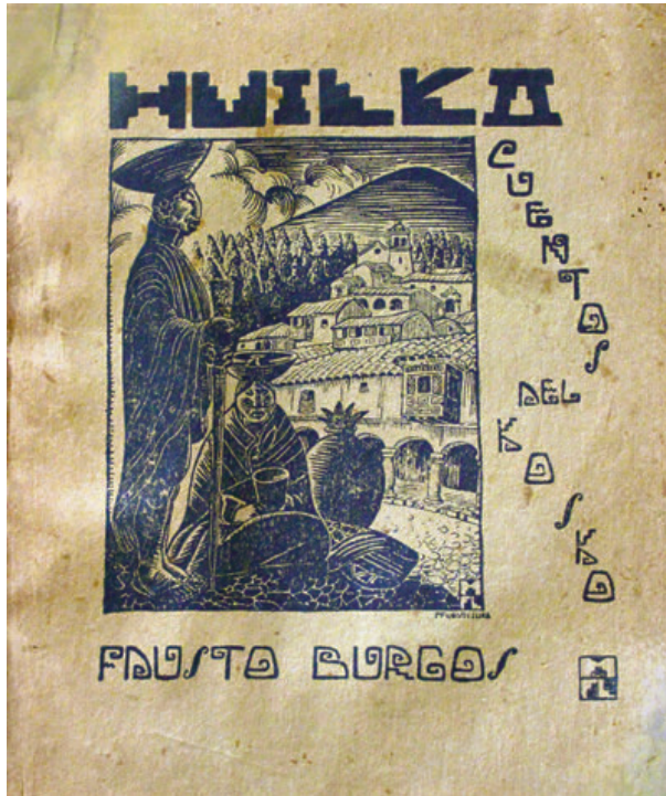
Figura 5. Mariano Fuentes Lira. Cubierta del libro Huilka. Cuentos del Kosko , de Fausto Burgos, San Rafael, Editorial Butti, 1938. Colección MLR.

asuntos estaban vinculados a temáticas autóctonas e identitarias. Este giro hacia la liberación de toda atadura academicista, basado en la reinterpretación contemporánea de lenguajes precolombinos, fue un claro eje de vanguardia que, en aquella ruta Cuzco-Buenos Aires, superadas las fronteras, nos convirtió en “modernos y americanos”.