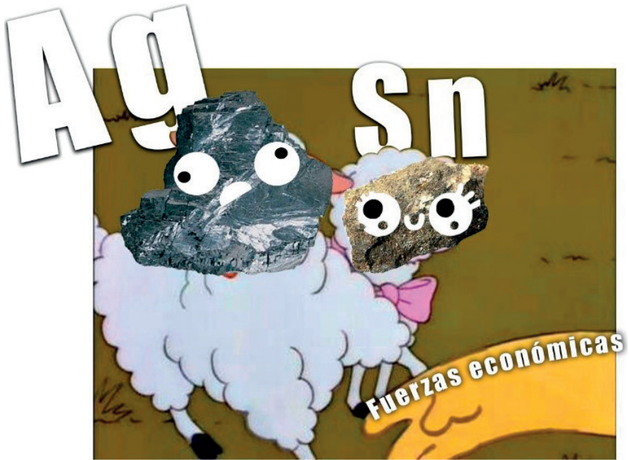
Como cuando las fuerzas económicas determinan el futuro del país.