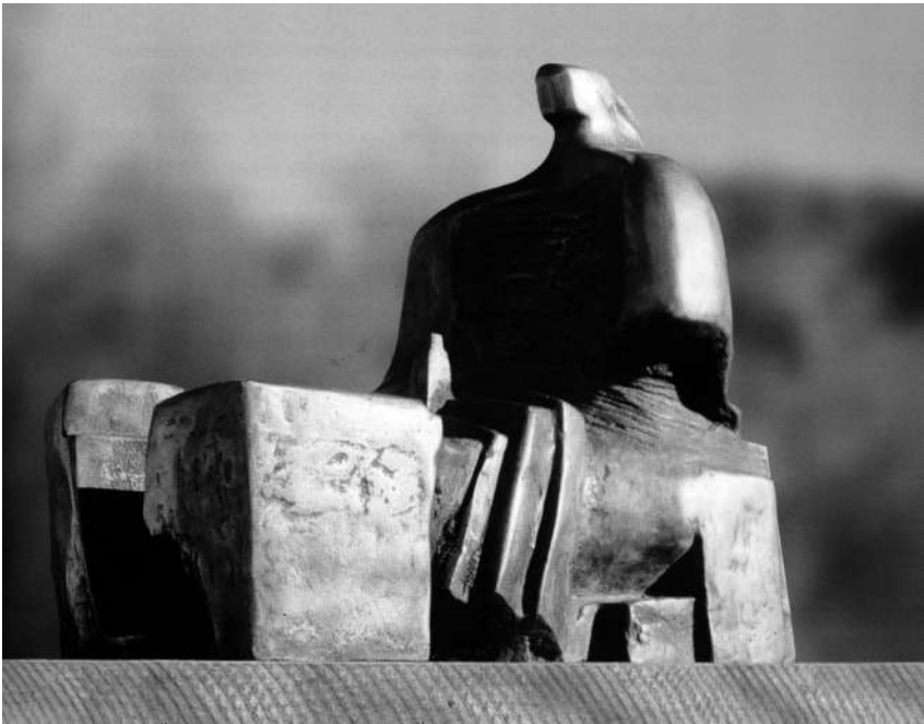
Ted Carrasco: Sin título