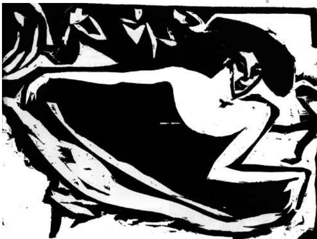
Ludwig Kirchner, "Bailadora"