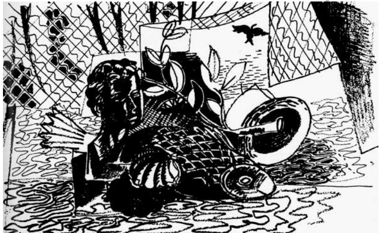
Pedro Pruna, “Naturaleza muerta”