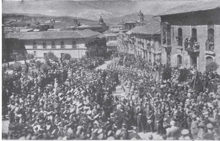
Un aspecto de la apoteosis tributada en La Paz a la “Sección de Hierro”