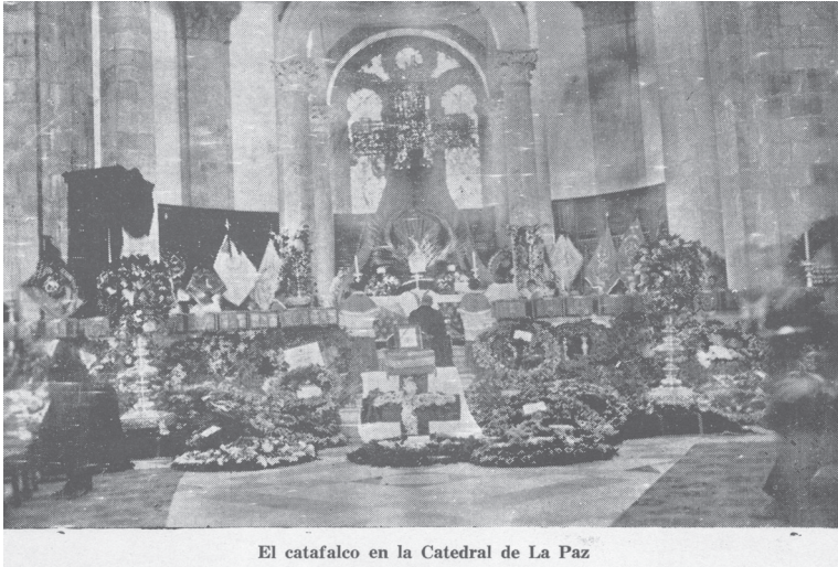
El catafalco en la Catedral de La Paz