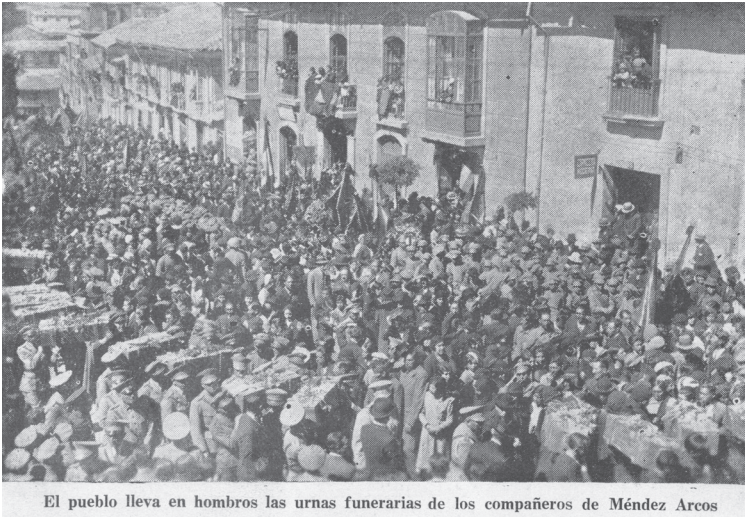
El pueblo lleva en hombros las urnas funerarias de los compañeros de Méndez Arcos

Finalmente, en la Figura 7, la última foto del libro, se ve en un primer plano al cortejo fúnebre en la plaza Alonso de Mendoza, donde se rinden los respectivos homenajes con un momento de solemnidad. En el pie de foto destaca la palabra “apoteosis”, que significa, según la RAE, “ensalzamiento de una persona con grandes honores o alabanzas”. Ello está relacionado con la figura del héroe que genera sentimientos “[de] admiración”; mientras “el héroe asciende, es asimilado al panteón y considerado una divinidad” (Sánchez et. al, 2024, p. 9).