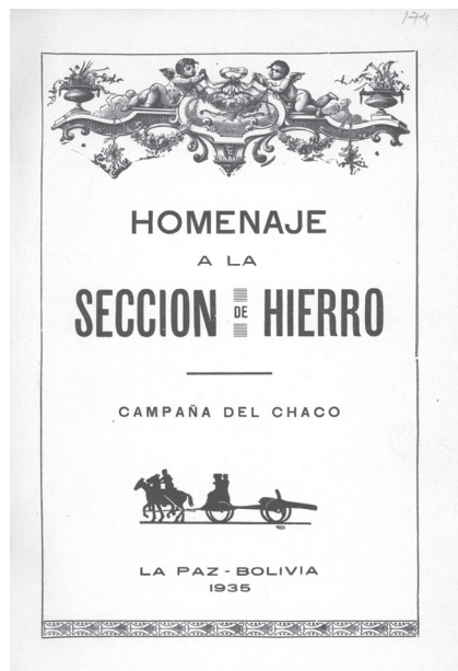
Figura 2 Portada del libro Homenaje a la sección del hierro

La Figura 2 es la portada o la primera página. Es la réplica del contenido de la cubierta, salvo que incluye la imagen de un carruaje tirado por caballos, que hace alusión al carruaje fúnebre que transporta los féretros.